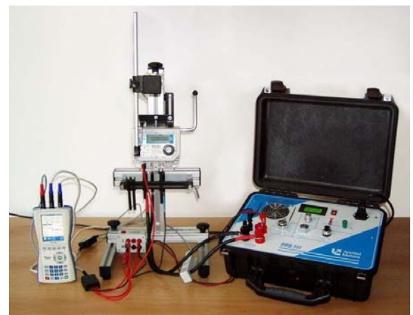
Zostava skúšobného zariadenia STE 1111