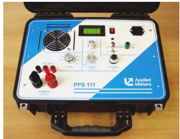
Prenosný fantómový zdroj PPS 111